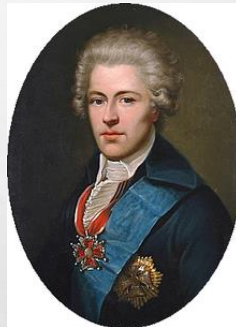
Portret Ignacego Potockiego z około 1784 roku