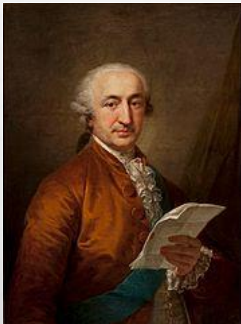
Stanisław Małachowski Obraz Jana Chrzyciciela Lampiego 1788-1789