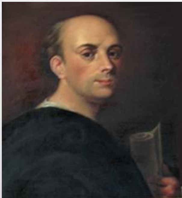
Scipione Piattoli – włoski ksiądz, prywatny sekretarz króla Stanisława Augusta Poniatowskiego, współtwórca Konstytucji 3 maja