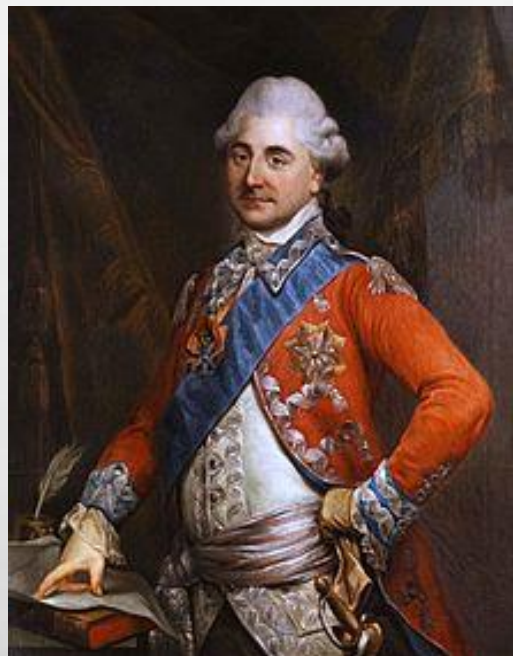
Stanisław August Poniatowski, portret Marcello Bacciarellego