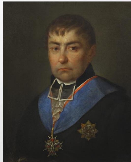
Portret Hugona Kollataja, Jan Pfeiffer 1810 r.