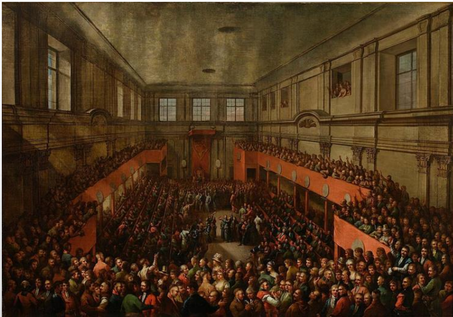
Uchwalenie Konstytucji 3 maja 1791 roku, obraz Kazimierza Wojniakowskiego z 1806 roku