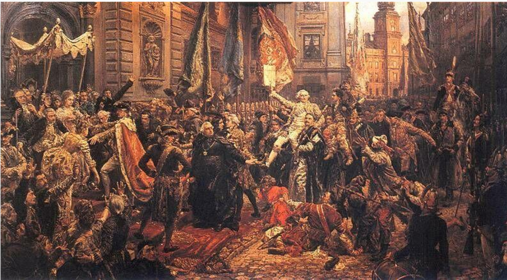
Uchwalenie Konstytucji 3 maja – obraz Jana Matejki 1891